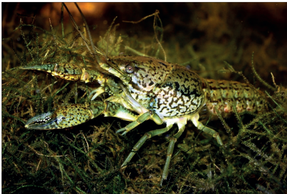
Obr. 5 Rak mramorovaný ( Procambarus fallax f. virginalis ).

Chov raka červeného ( Procambarus clarkii ) je při splnění minimálních požadavků na velikost nádrže a krmení většinou bezproblémový. Oproti tomu držení, chov a odchov citlivých nebo případně agresivních druhů, jako jsou např. raci rodu Cherax , je náročný a není vhodný pro začátečníky.