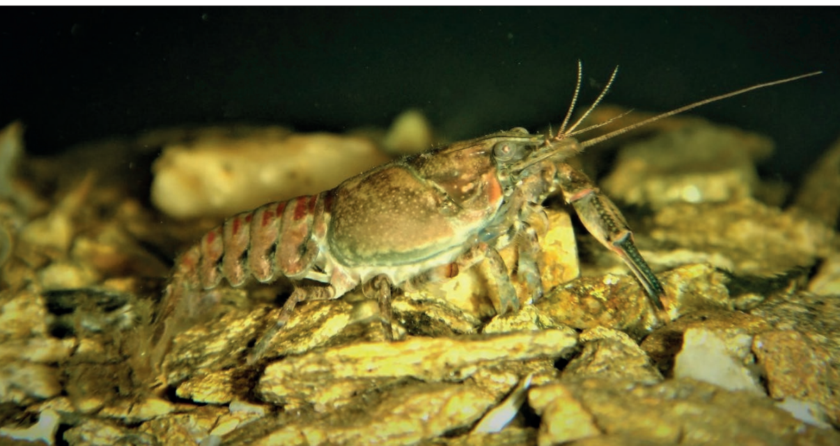
Obr. 1 Rak pruhovaný ( Faxonius limosus ).

Uvádí se, že rak bahenní byl na našem území vysazen v roce 1892, a to do rybníků na Loučensku, Mladoboleslavsku, Chlumecku a Blatensku. Obecně je přijímáno, že dovezení raci pocházeli z východní Haliče (historické oblasti na pomezí Polska a Ukrajiny) z povodí řeky Dněstru. Odtud dřívější názvy rak polský či haličský (Kozák et al. 2013). Jeho dovoz souvisí s posílením račích populací, zdecimovaných na přelomu 19. a 20. století znečištěním vody kvůli rozvoji průmyslu i lidských sídel, nedostatečnému čištění odpadních vod i výskytem račího moru (Kozubíková-Balcarová 2013).