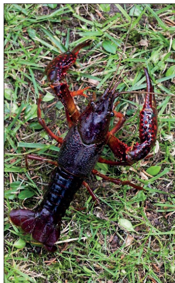
Obr. 4 Rak červený ( Procambarus clarkii ).

Většina druhů raků má noční nebo soumráchnou aktivitu, ale v akváriu si raci celkem bez problémů navyknu na režim určený chovatelem a zanedlouho začnou přijímat potravu i přes den. Někteří jedinci se naučí brát krmení z pinzety a někdy dokonce i z ruky. Pokud je v nádrži chováno více raků pohromadě, je důležité umísťovat krmivo po celé nádrži. Pokud by se krmivo dávalo na jedno místo, silnější raci by nenechali nasytit menší a slabší jedince. Dospělé raky je třeba krmit alespoň třikrát za týden, před svlékáním krunýře pak každý den. Gravidní samice přijímají potravu jen v omezené míře, proto je nutné snížit krmné dávky až na jednu třetinu. Jako vhodné krmení lze použít vodní a bahenní rostliny, vláknité zelené řasy, sinice rodu Arthrospira , dubové listí, spařené kopřivy, smetánku lékařskou, špenát a hlávkový salát, vařené brambory, strouhanou mrkev, salátovou okurku, krmnou řepu, hrách, kukuřici, vařenou a nesolenou rýži, vařené těstoviny, sušené mořské řasy, živé, mražené a lyofilizované (vysušené za pomoci mrazu) vodní larvy hmyzu, žábronožky, perloočky, buchanky, nitěnky,