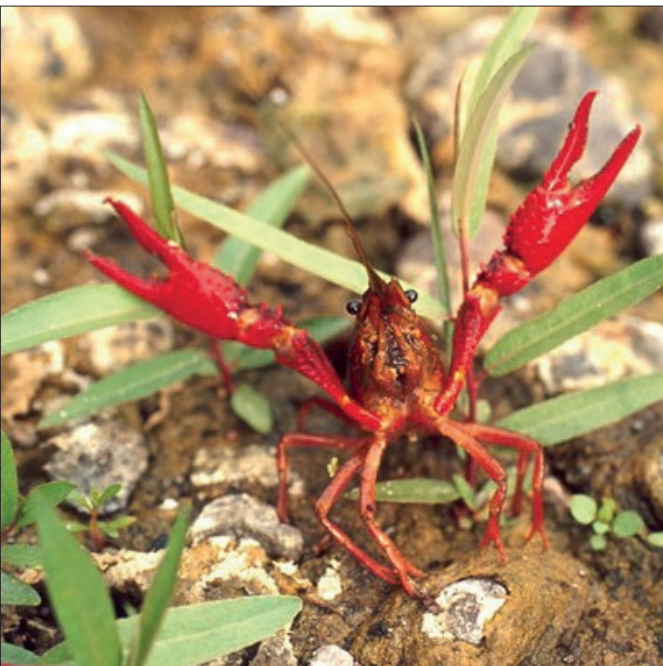
Obr. 2 Varovný postoj raka červeného ( Procambarus clarkii ).