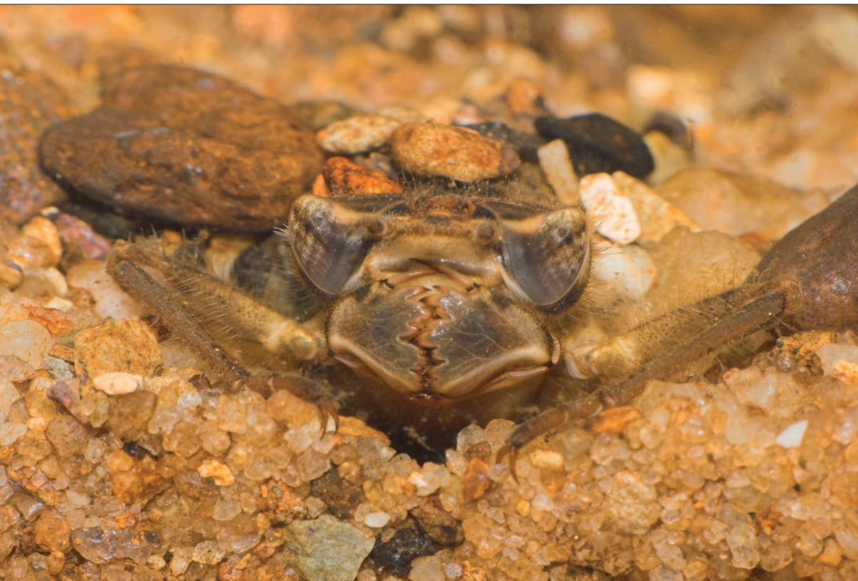
Obr. 4 Detail hlavy nymfy páskovce rodu Cordulegaster zahrabané v substrátu.

v různém objemu vody. Pandion a kol. (1979) studovali intenzitu lovu komářích larev různě velkých nymf asijské klínatky Mesogomphus lineatus . Mathavan (1976) zjišťoval u téhož druhu klínatky čas nasycení při lovu komářích larev v různě teplé vodě. Bergelson (1985) studoval predační aktivitu nymf šídla Anax junius (tento druh obývá Severní Ameriku a východoasijské pobřeží, vzácně byl zaznamenán i v Evropě) a na základě laboratorních arénových experimentů zjistil, že nymfy pronásledovaly ze dvou typů nabídnuté kořisti tu hojnější, navíc byl potvrzen princip, že larvy preferovaly ten typ kořisti, kterou bezprostředně v minulosti