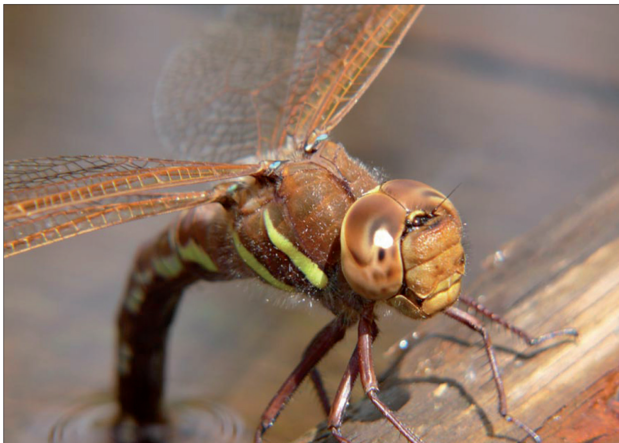
Obr. 1 Samička šídla velkého ( Aeshna grandis ) kladoucí vajíčka (foto V. Vilimovský)

Vajíčka subtilních šidílek (podřád Zygoptera, stejnokřídlice) lze nalézt nakladená na listech vodních rostlin, když jsme předtím pozorovali samičku, kam kladla vajíčka. Vajíčka jsou zařazena do listů v řadě podél okraje nebo do kruhu kolem otvoru v listu. Některé vážky (např. Sympetrum , Libellula , Gomphus sp.), patří do podřádu Anisoptera (různokřídlice), však kladou vajíčka přímo do vody (Obr. 1).