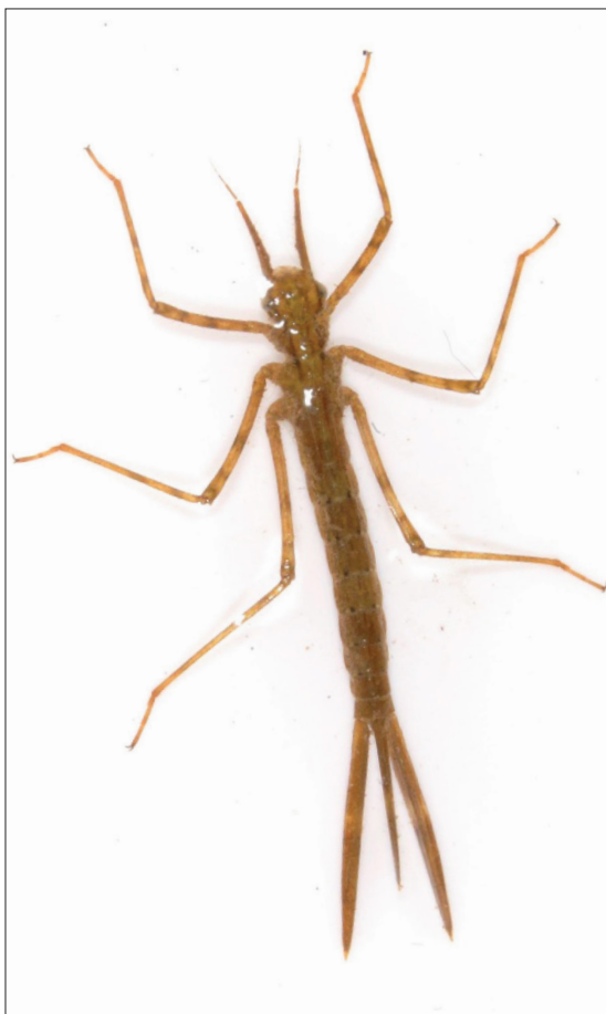
Obr. 2 Nymfa motýlice rodu Calopteryx z Vlašimské Blаницe (lokality Ostrov u Louňovic pod Blanicem).

K chovu vážek ze stojatých vod lze použít běžně zařízené malé akvárium s písčítokamenitým dnem a vodními rostlinami. Pro druhy, které žijí v místech s nánosy detritu a úlomků rostlin (např. Libellula , Gomphus ), lze dno akvária pokrýt vrstvou rozdrobeného listí. Příklad nymfy z podřádu