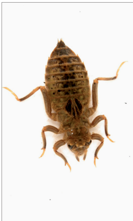
Obr. 3 Nymfa klínatky obecné ( Gomphus vulgatissimus ) z Vlašimské Blanice (lokality Ostrov u Louňovic pod Bláníkem).

stejnokřídlic ( Zygoptera ) je uveden na obr. 2 , zástupce podřádu různokřídlic ( Anisoptera ) pak na obr. 3 . Pokud chováme nymfy z rychle proudících vod (např. páskovců rodu Cordulegaster , které se zahrabávají do substrátu, viz obr. 4 ), je vhodné použít kombinaci drobného štěrku a písku a je nutno vzduchovat či použít filtr, aby se zajistila v akváriu trvalá cirkulace vody.