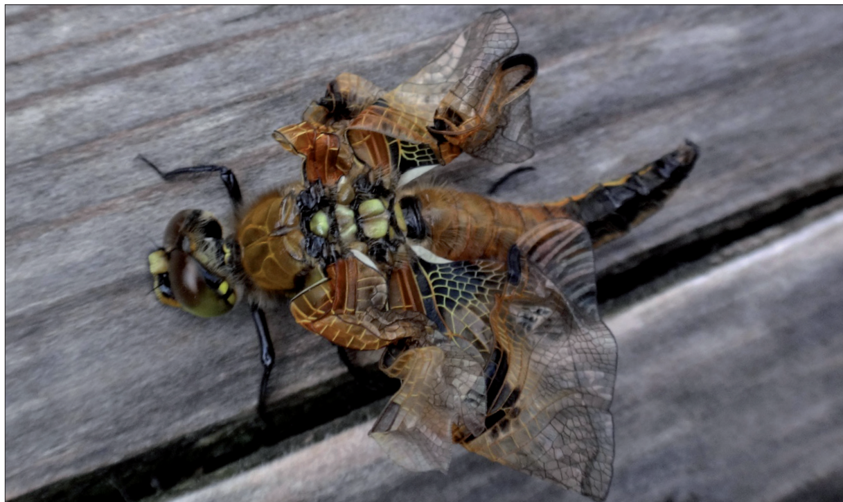
Obr. 6 Defektní jedinec vážky čtyřskvrnné ( Libellula quadrimaculata ) se zmuchlanými křídly nalezený na Chalupské slati na Šumavě.

na hřbetě pokožka podélnou trhlinou, která se táhne od záhlaví na konec zadohruď. Vzniklým otvorem se pracně začíná imago soukat ven. Nejprve se objeví hlava, pak hrud' s dosud složenými křídly a část zadečku. Konec zadečku dosud vězí v exuvii. V tomto stádiu imago, jako by bylo dosavadní námahou unaveno, přepadne hlavou dolů nad zadeček exuvie, v které dosud vězí konec těla, a v této poloze setrvává delší dobu (obr. 5/3). Je to jakási doba odpočinku, během které pokožka imaga tvrdne. Po chvíli se přehodí imago tak, že hlava a hrud' se ocitnou nad exuvií a imago se přichytí nožkami stébla či větvičky (obr. 5/4). Pak dojde k vytažení zadečku a imago je tak zcela vysunuto z exuvie (obr. 5/5). Corbet (1999) stanovil čtyři základní fáze při přeměně nymfy v dospělé, později Andrew a Pa-