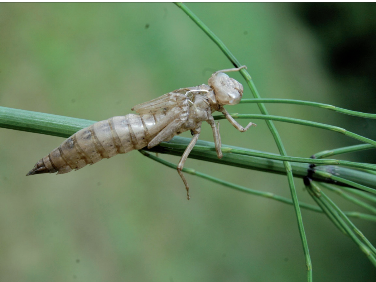
Obr. 7 Dobře zachovalá exuvie šídla zachycená na vegetaci v přírodní rezervaci Podlesí (CHKO Blaník).

Tento určovací klíč a publikaci Waldhausera a Černého (2014) lze získat na Podblanickém ekocentru Českého svazu ochránců přírody ve Vlašimi (více viz https://www.csopvlasim.cz/ ).