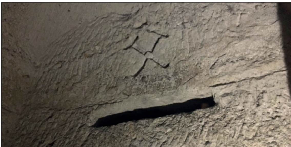
Obr. 3 Cesta šachtami: Hornický znak – zkřížené mlátek a želízko. Znak byl vytesán nad nově raženou štolou spolu s datem zahájení těžby.