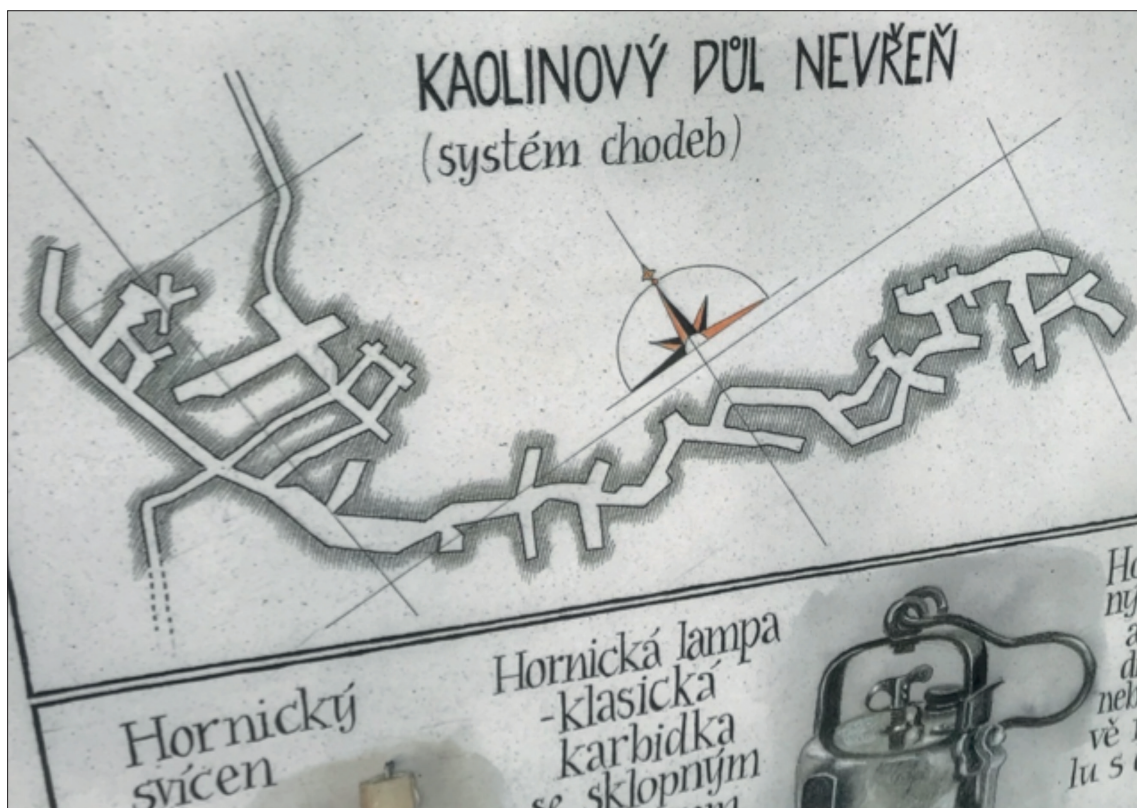
Obr. 1 Tabule naučné stezky

Pekelnou práci měli čeští filmaři, kteří v prostorech dolu točili část pohádky Čertí brko, vánoční báchorky s Ondřejem Vetchým v roli Lucifera.