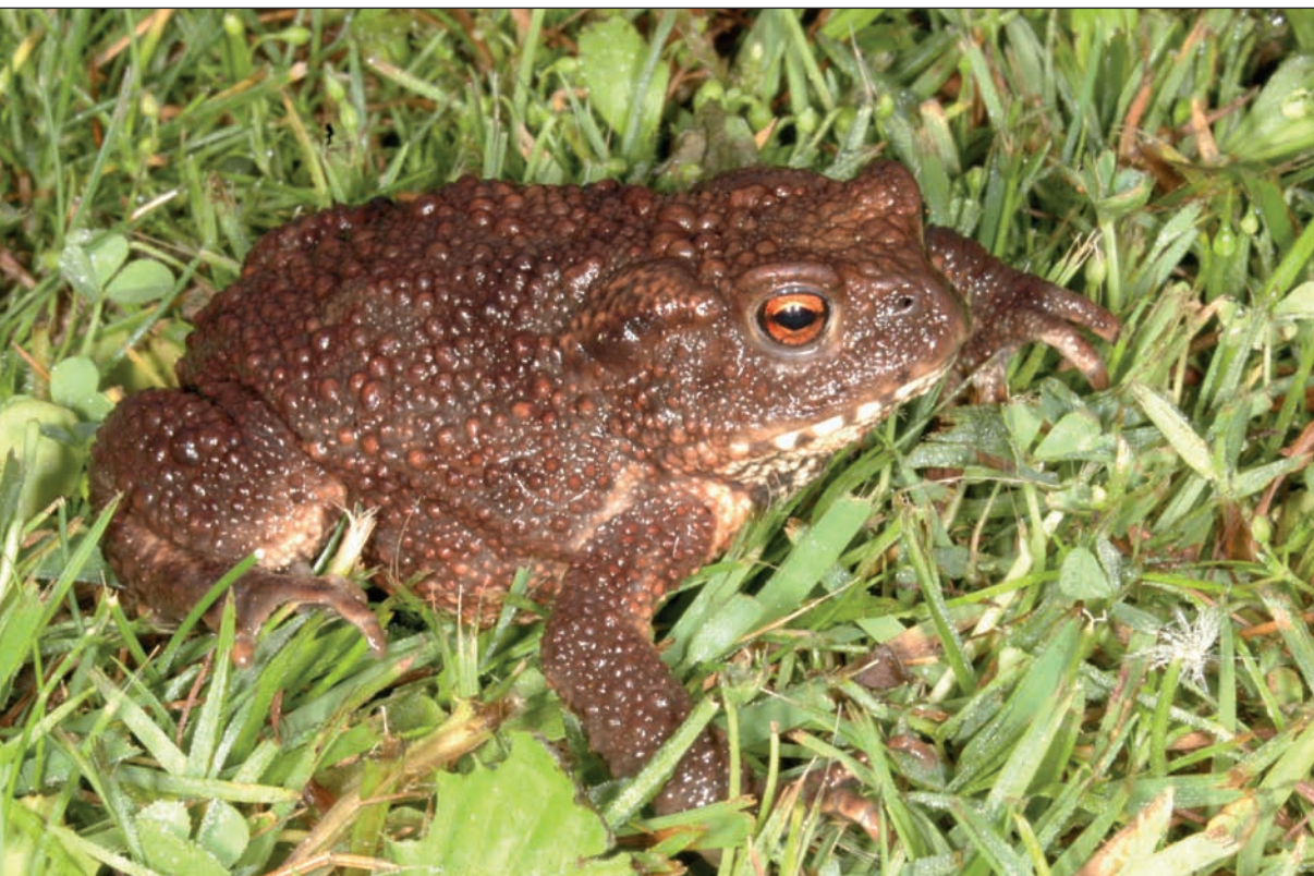
Obr. 1 Ropucha obecná ( Bufo bufo ). Barevně na str. 47.

České pojmenování ocasatých obojživelníků žebrovníků vystihuje jejich unikátní způsob obrany. Jako zbraň proti nepřátelům používají svá