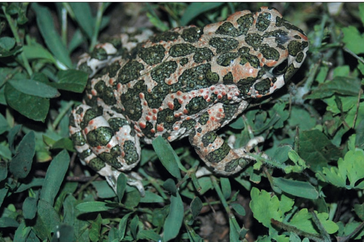
Obr. 3 Ropucha zelená ( Bufo viridis ). Barevně na str. 48.

Nejznámějšími silně toxickými žábami jsou jihoamerické pralesničky čili dendrobátky rodů